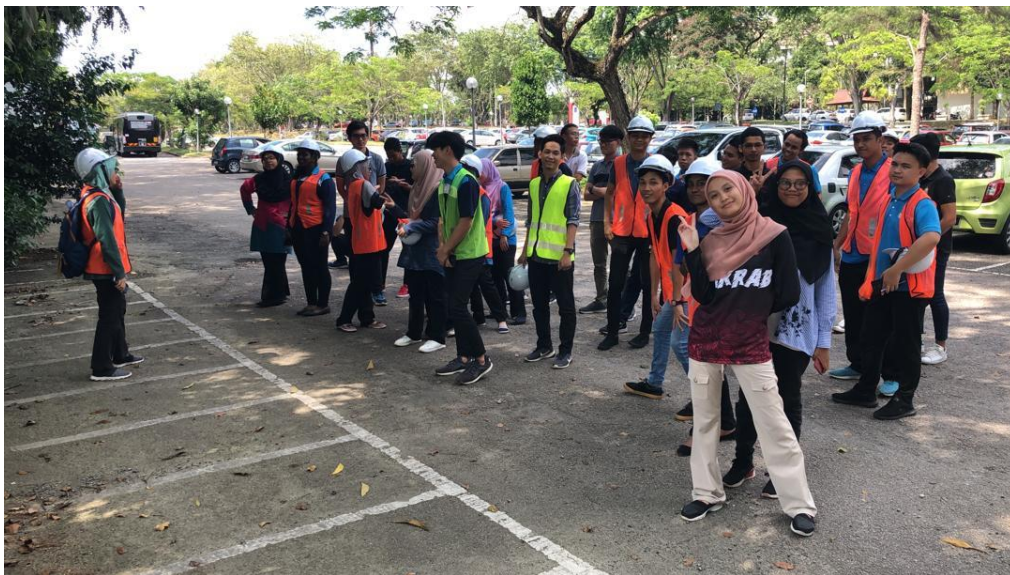
Historian mengira warga yang keluar dengan selamat