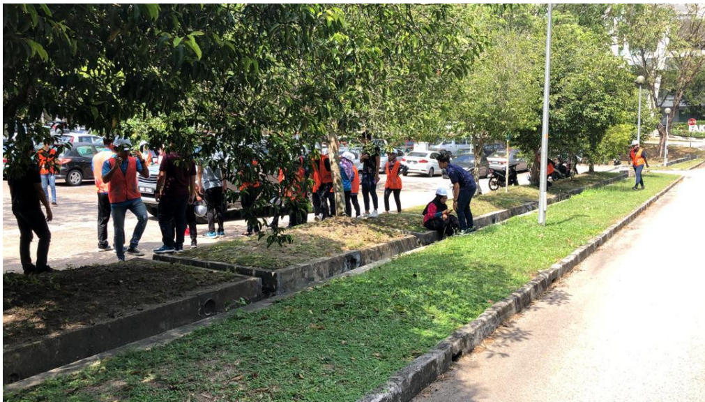
Peserta berkumpul di kawasan yang ditetapkan (Kawasan Berkumpul)