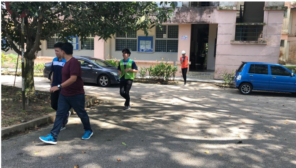
Peserta bergerak apabila lonceng kecemasan berbunyi